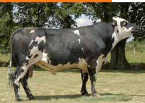
Toro con buena Tasa Proteica y excelente índice de Esqueleto. Utilizarlo para mejorar Tamaño, Profundidad de Pecho, Longitud de Anca y Distancia Piso de la Ubre - Corvejón, en hembras con buenos Aplomos y Anca Invertida u Horizontal. Debe utilizarse con precaución en Novillas.