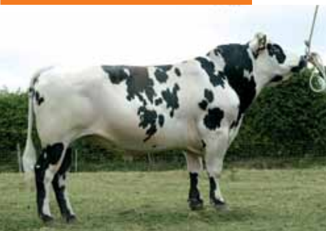
Toro con excelente índice lechero. Utilizarlo para mejorar Tamaño, Anchura de Isquiones, Aplomos y Musculatura, en vacas con buena conformación general de la Ubre. No debe utilizarse en Novillas.